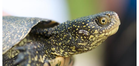
Europäische Sumpfschildkröte ( Emys orbicularis )

In der Schweiz lebt nur eine heimische Schildkrötenart, die Europäische Sumpfschildkröte ( Emys orbicularis ). Wie die natürliche Verbreitung dieser Art hierzulande in historischer Zeit ausgesehen hat, ist und bleibt unklar. Heute existieren sich regelmässig fortpflanzende Populationen nur im Kanton Genf und im Seeland zwischen Marin, Le Landeron und Kerzers.